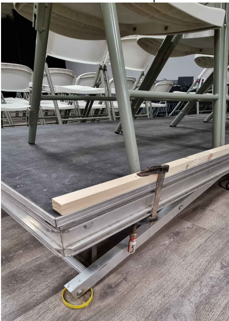
(tasseau et serre-joint)

EQUIPER le fond des praticables de tasseau maintenus par des serres-joints cf photo 1 et 2